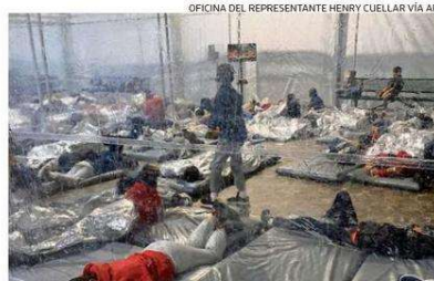
DETENIDOS EN UNA INSTALACIÓN TEMPORAL DE ADUANAS EN TEXAS.

El objetivo de la gira es "desarrollar un plan de acción eficaz y humano para gestionar la migración" irregular procedente en su mayoría del Triángulo Norte de Centroamérica, dijo la portavoz del Consejo de Seguridad Nacional de la Casa