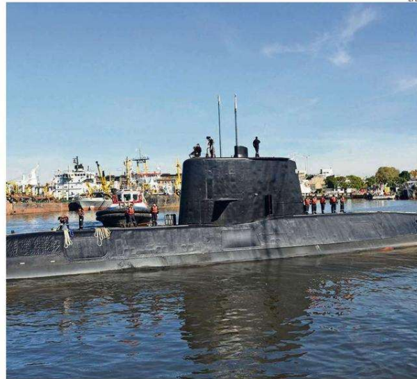
EL SUBMARINO ARA "SAN JUAN", DE FABRICACIÓN ALEMANA, NO CUMPLÍA CON EL MANTENIMIENTO.

El 15 de noviembre de 2017 se perdió todo rastro del ARA "San Juan" cuando navegaba desde Ushuaia, en el extremo sur de Argentina, hacia su base en Mar del Plata, 400 kilóme-